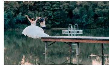
Lok's Wedding findet heuer zum 9. Mal statt.