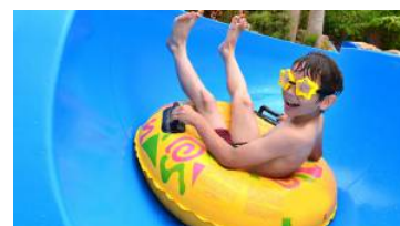
Der Kinderhotelführer ist nun erschienen.

fürer im deutschsprachigen Raum mit Hotels in Österreich, Deutschland, Italien und weiteren Ländern auf den Markt gebracht. „In unserem Buch präsentieren wir ausgewählte Familienhotels mit Kinderbetreuung über das klassische Kinderhotel mit einem Rundumservice für Kinder bis hin zum familienfreundlichen 5-Sterne-Wellnesshotel“, erzählt Redaktionsleiter Roland Bamberger. Neben der Auflistung der Hotels sind auch über 1.000 Bilder und viele Detail-